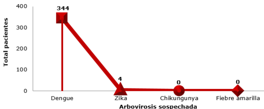
Figura 2. Distribución de pacientes con sospecha de arbovirosis

En cuanto a los recursos humanos participantes en la vigilancia y lucha antivectorial predominó la presencia de estudiantes (56,8 %) (figura 3).