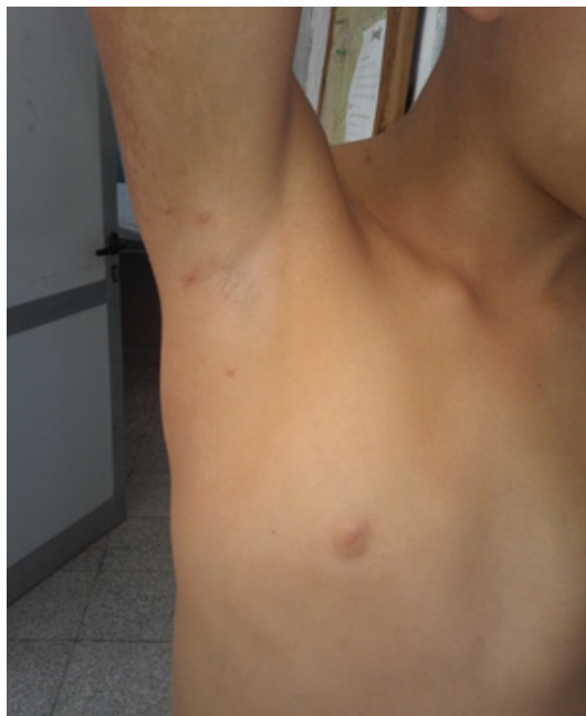
Figura 2. Máculas hipocrómicas que siguen las líneas de Blaschko en miembro superior derecho y región anterosuperior del hemitórax ipsilateral.

En el examen físico se encontró talla 165,7 cm (talla para la edad [T/E] > 97 percentil), apéndice preauricular unilateral derecho, máculas hipocrómicas que siguen las líneas de Blaschko en miembro superior derecho y región anterosuperior del hemitórax ipsilateral (figura 2), hernia umbilical, agenesia pectoral unilateral derecha, hiperlaxitud articular de las extremidades y escoliosis dorsolumbar (figura 3).